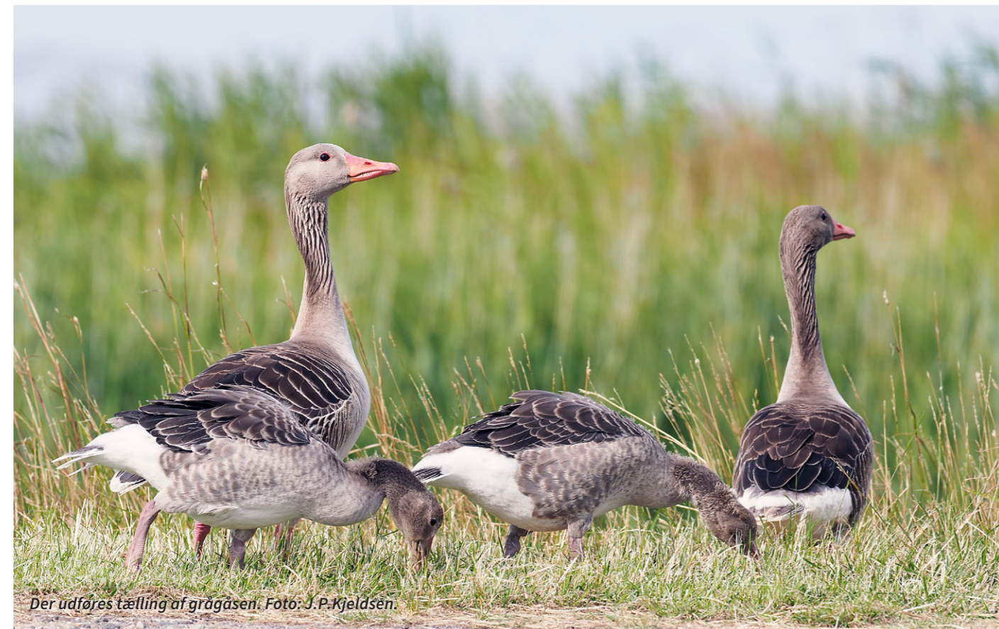
Der udføres tælling af grågåsen.

standsmål, og begge enheder skal forvaltes som selvstændige enheder. Bestandsmålet for den trækkende enhed er 70.000 ynglepar og 80.000 ynglepar for enheden bestående af standfugle. Som redskab til at stabilisere bestanden vil man bruge enten jagt eller regulering, som der kan skrues op eller ned for, afhængigt af hvordan bestanden reagerer.