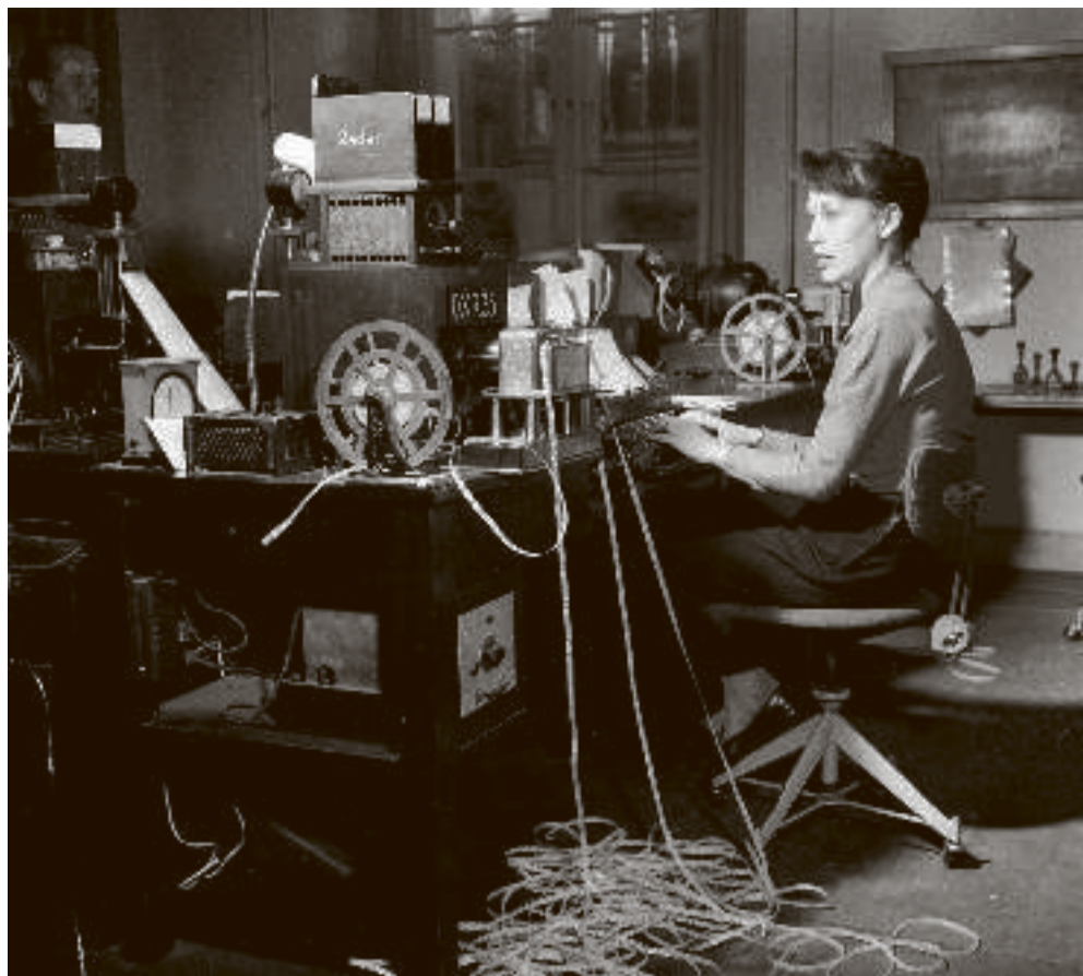
Den Internationale Telegrafunion blev oprettet i 1865. I dag har den skiftet navn til International Telecommunication Union og hører under FN.

Det tydeligste tegn på, at noget er under forandring, er, at Obama faktisk har forsøgt at genopbygge tilliden til de internationale organisationer – uden meget held. De aftaler der er forhandlet frem – klimaaftalen i Paris, TPP og atomaftalen med Iran – står for fald med Trump ved roret. Han har nemlig et andet bud på, hvordan USA skal takle sin