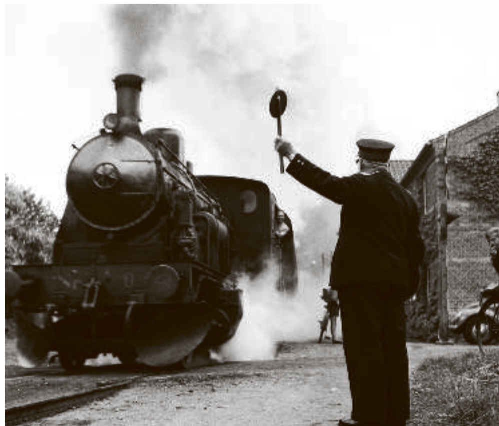
Da jernbanespor blev lagt ud over store dele af landjorden, blev koordinationsarbejdet samlet i Den Internationale Forening for Togkongresser (1885).

relative tilbagegang: snæver bilateralisme. Det efterlader plads til andre, såsom Kina, der i stedet bestemmer spillereglerne.