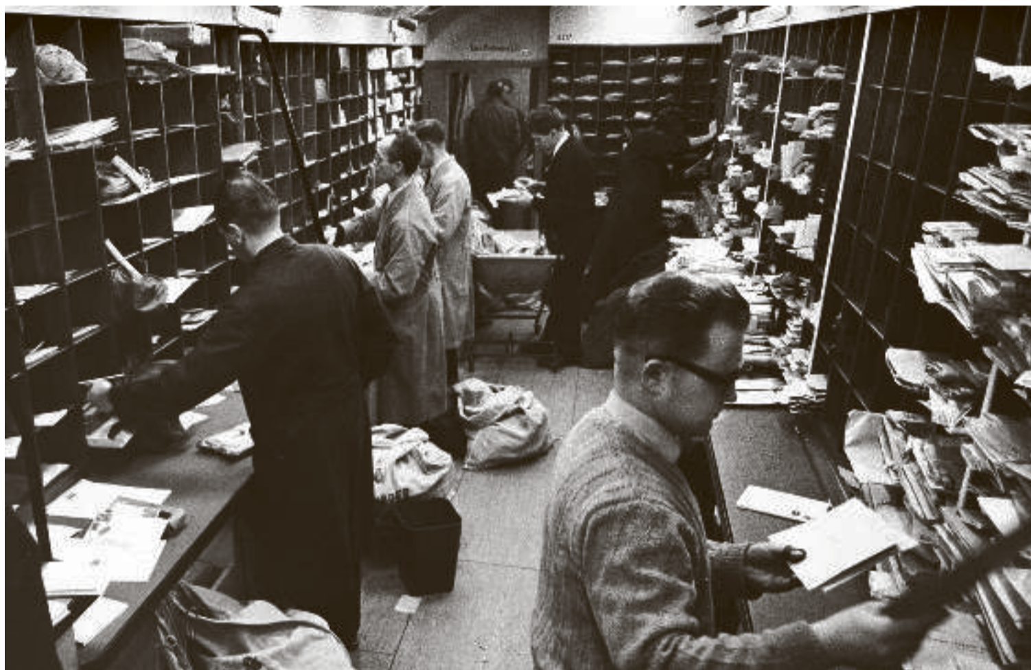
Omdeling af post over hele verden krævede fælles international koordinering. Det tog Den Universelle Postunion (1874) sig af.

I Vesteuropa fik man et særlig tæt samarbejde nationalstaterne imellem, med USA som den primære støtte. OEEC (senere OECD), der administrerede Marshallhjælpen, EF (i dag EU) og Europarådet var alle måder at